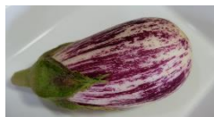
ゼブラなす(縞なす)